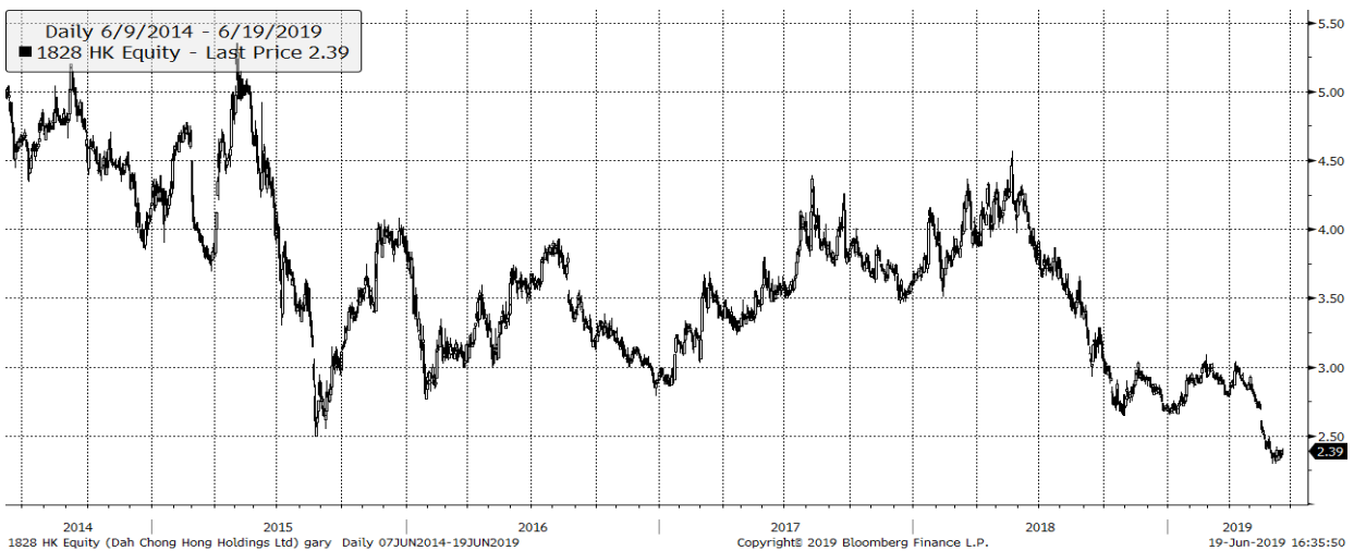
圖 3：大昌行集團 ( 1828 ) 股價圖